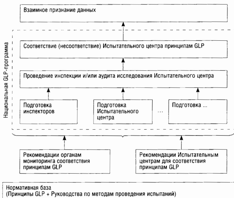
Рис. 1. Основа построения национальной Программы с учетом требований ОЭСР

ций, а также содержат рекомендации органам мониторинга по оценке отдельных процедур и процессов инспектируемых ИЦ.